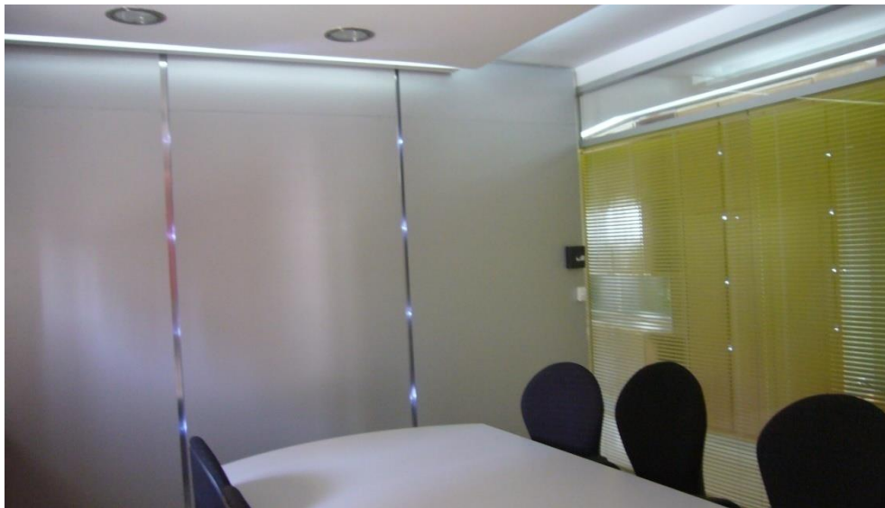
Salle de réunions et documentations