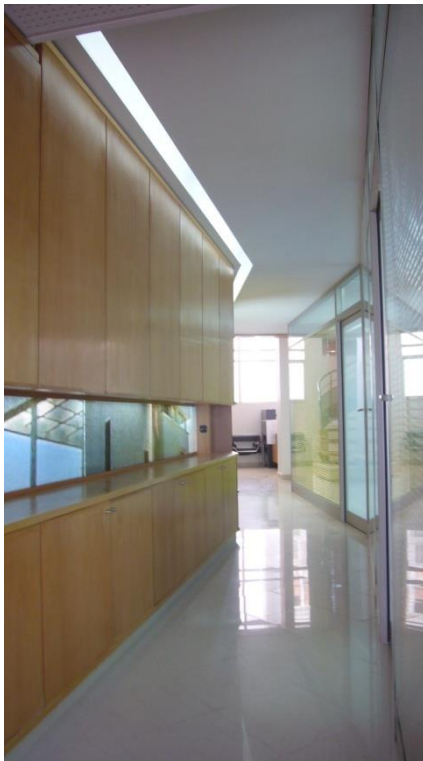
Rez de chaussée