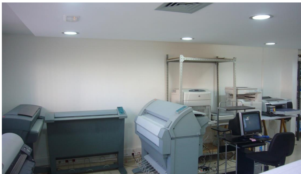
Moyens de reproduction