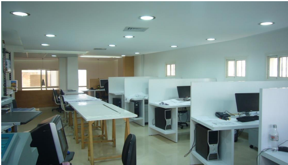
Salle de production et dessin